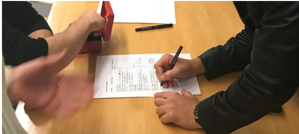
Abb. 1: Aktienzeichnung an der Gründerversammlung

Gründen Sie und führen Sie ein reales Miniunternehmen und erleben Sie während eines Schuljahres, was es heisst, eine Unternehmerin/ein Unternehmer zu sein.